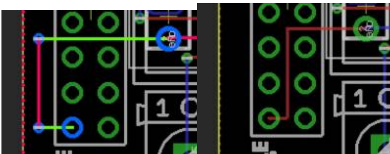
Fig. 10: zwei unnötige Vias: THD-Komponenten können von beiden Seiten angeschlossen werden. (rechts: Verbesserung)

Bei Vias sollte geprüft werden, ob diese tatsächlich notwendig ist. Auch bei der Anwendung von Manhattan-Routing hilft eine abschließender Check ob der Layer-Wechsel notwendig ist.