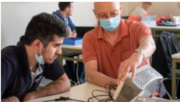
Fig. 1: ET1 Labor im SS2020