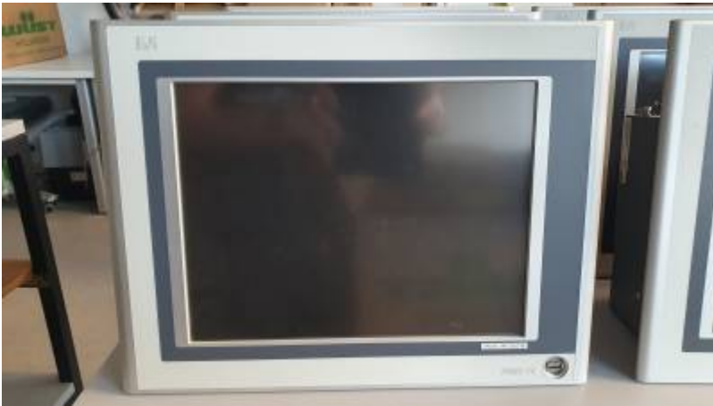
PANEL PC 5PC720 - Anschlüsse 1