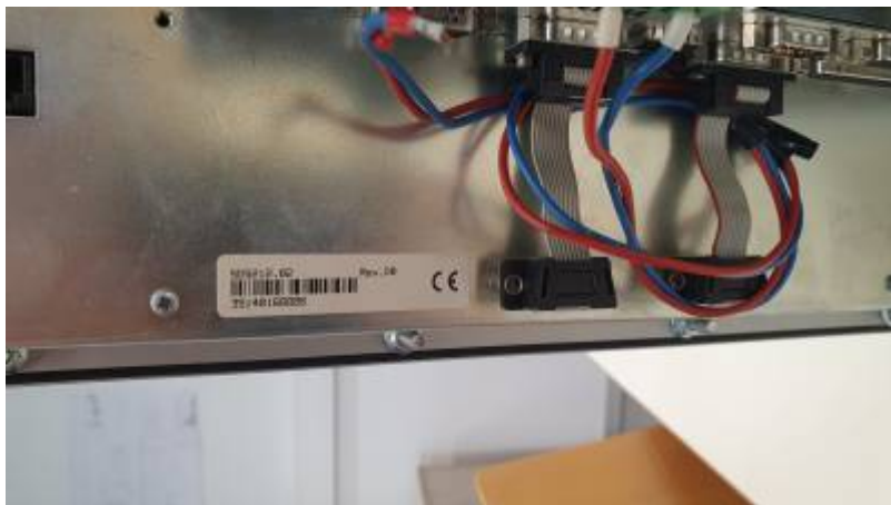
PROVIT 5200 - Anschlüsse 1