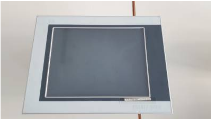
PROVIT 5200 - Vorderseite