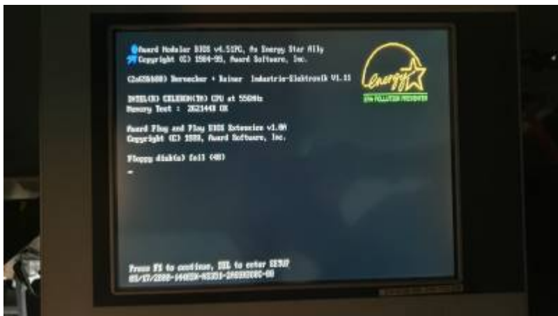
PROVIT 5200 - Test