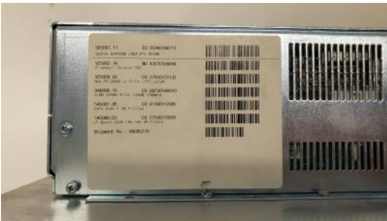
PROVIT 5200 - Bestückung