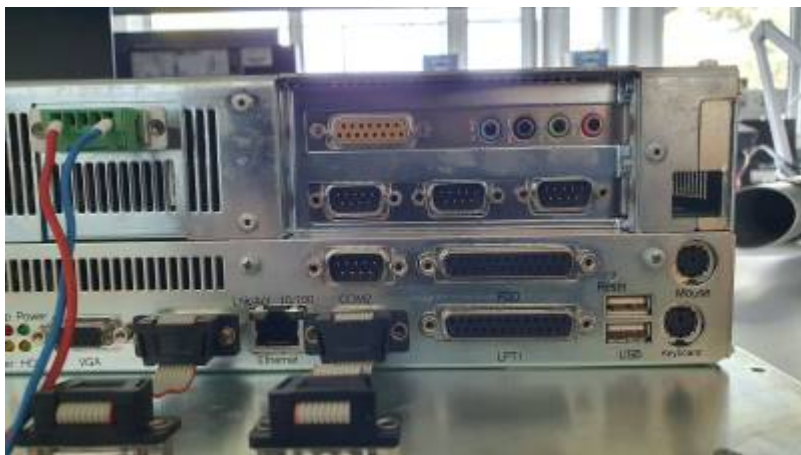
PROVIT 5200 - Anschlüsse 2