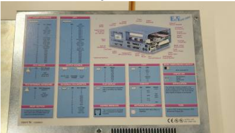
PROVIT 5200 - Bestückung Details