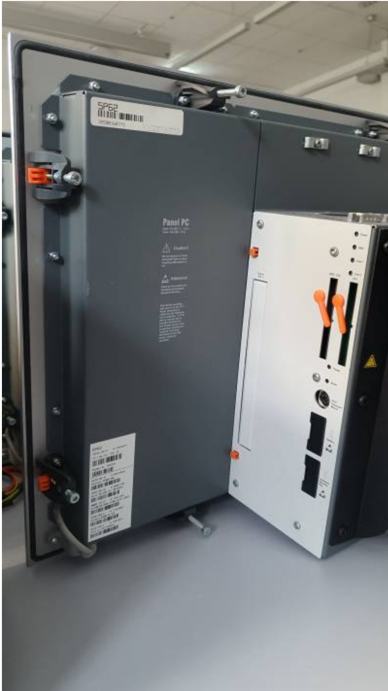
PANEL PC 5PC720 - Bestückung