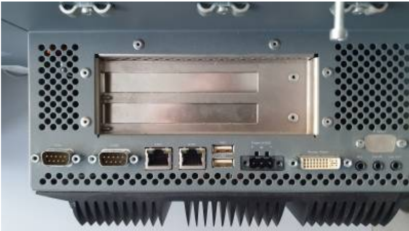
PANEL PC 5PC720 - Anschlüsse 2