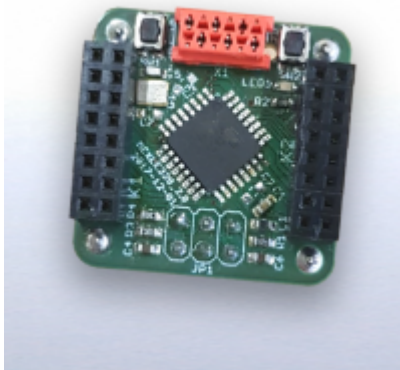
Fig. 2: fertige MMC 1x1 328PB Platine

Das Basis-Hookup dient als Grundlage, um Platinen zu entwickeln, welche auf die beiden 2×8 Buchsen der Microcontrollerplatine (links und rechts in figure 2 ) aufgesteckt werden können. Damit ist es u.a. möglich 2 I2C-, 2 SPI und 8 Analog-Digital-Converter genutzt werden. Details zur Pin-Konfiguration ist unter der Platine MMC 1x1 328PB beschrieben.