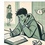
Too few modern...