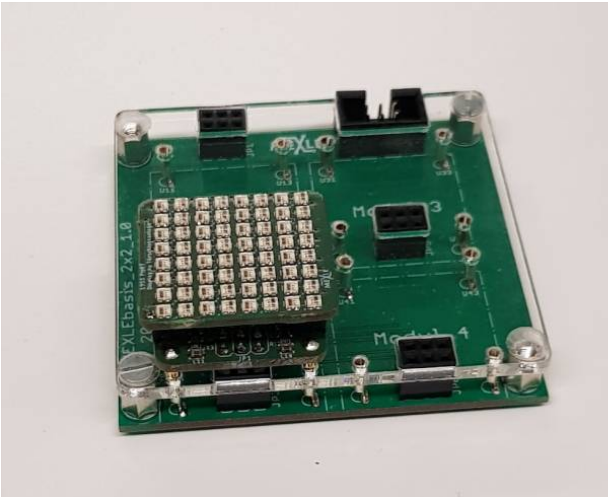
MEXLE Microcontroller Board mit selbst entwickeltem 8x8 Farb-LED Matrix (WS2812) auf 25x25mm 2