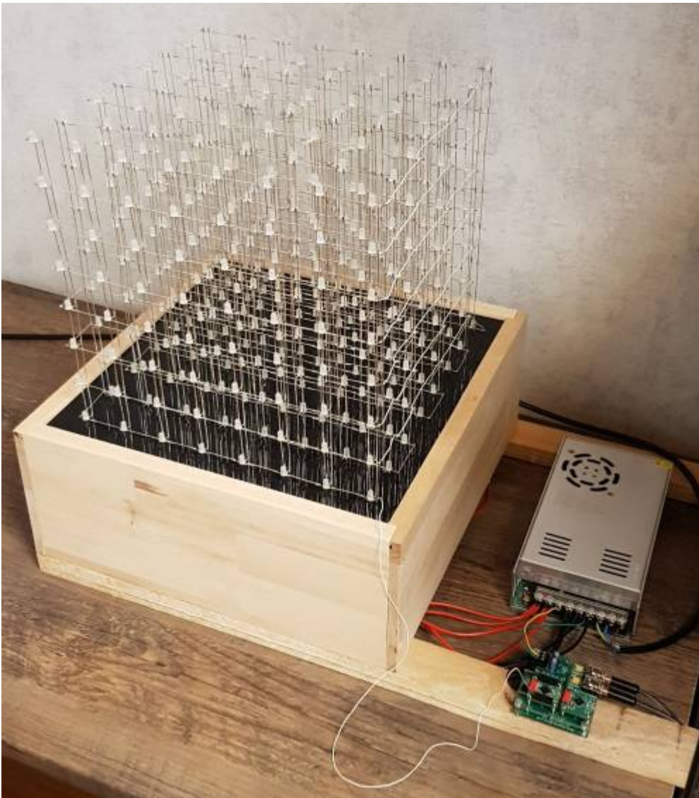
LED cube entwickelt im 3. Semester Mechatronik und Robotik