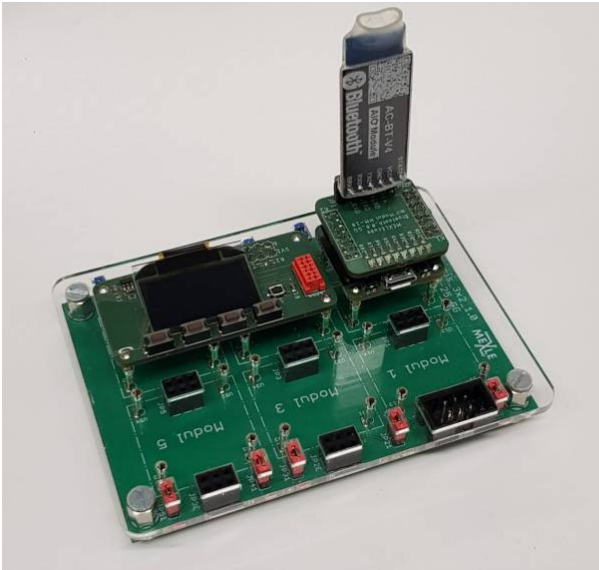
MEXLE Microcontroller Board mit Bluetooth-Dongle und Display/Tasten Board