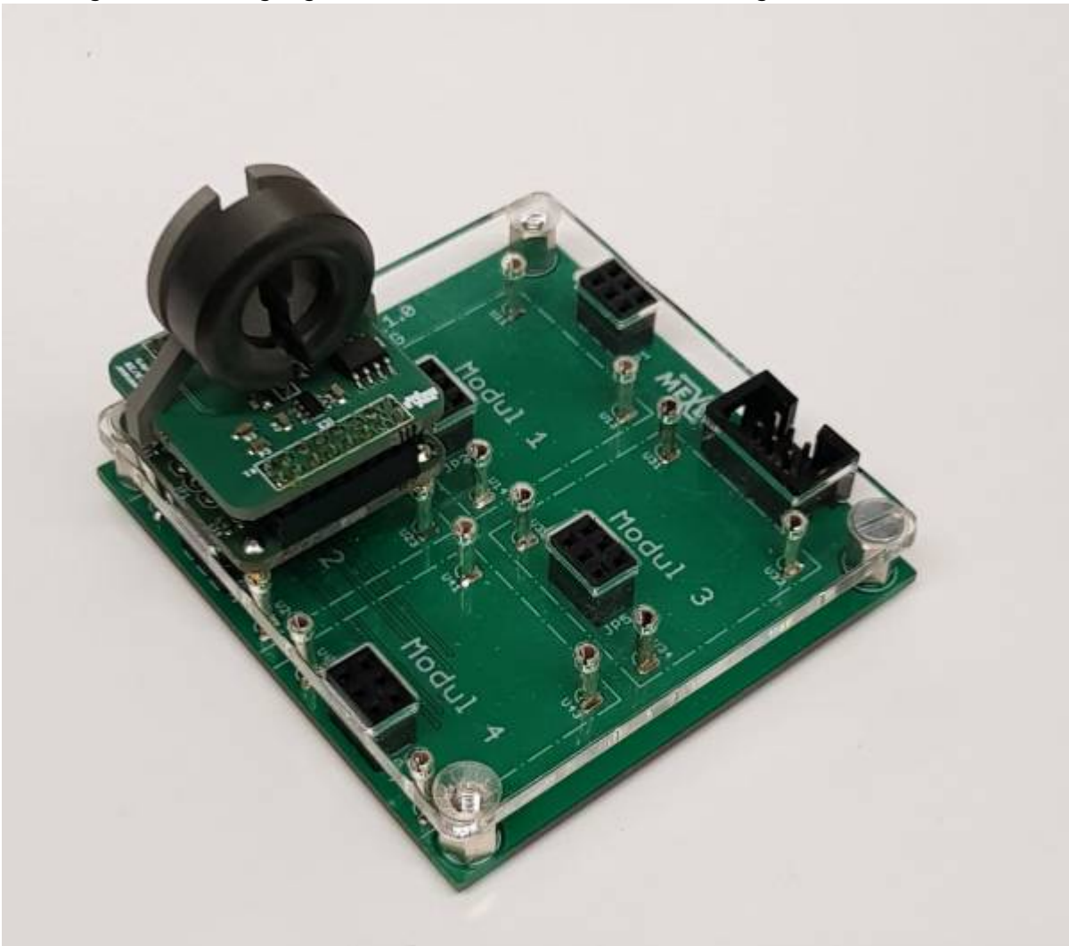
Stromsensor zur berührungslosen Messung bis 3A als Hookup auf einem Board mit ATmega328