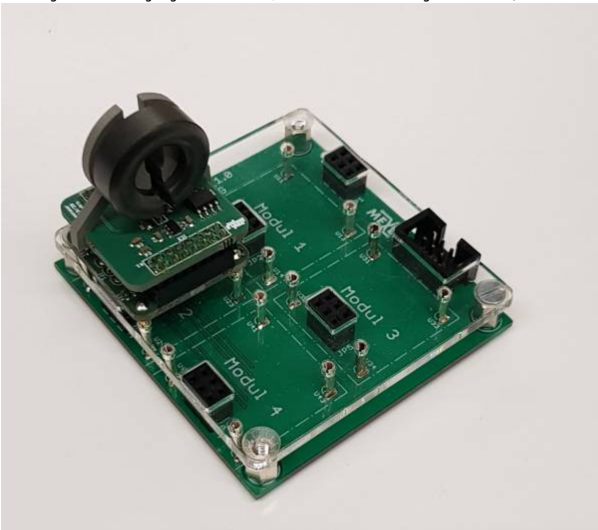
Stromsensor zur berührungslosen Messung bis 3A als Hookup auf einem Board mit ATmega328