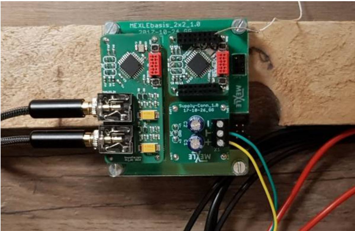
Elektronik des LED cube auf MEXLE2020 Basis (zwei ATmega328 zur Auswertung von Musiksignalen mit Eingangsfilter und FFT, sowie zur Ansteuerung des Würfels)