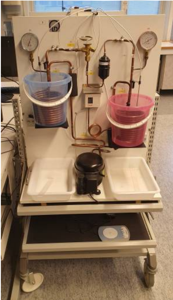
Physiklabor Bild 2