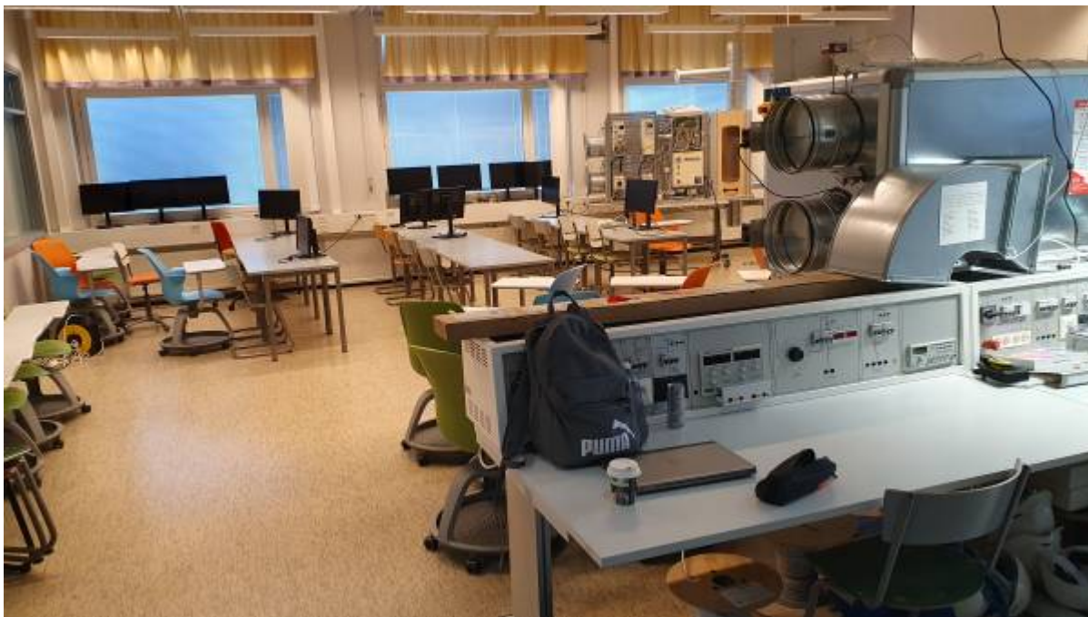
Energietechnik-Labor Bild 1