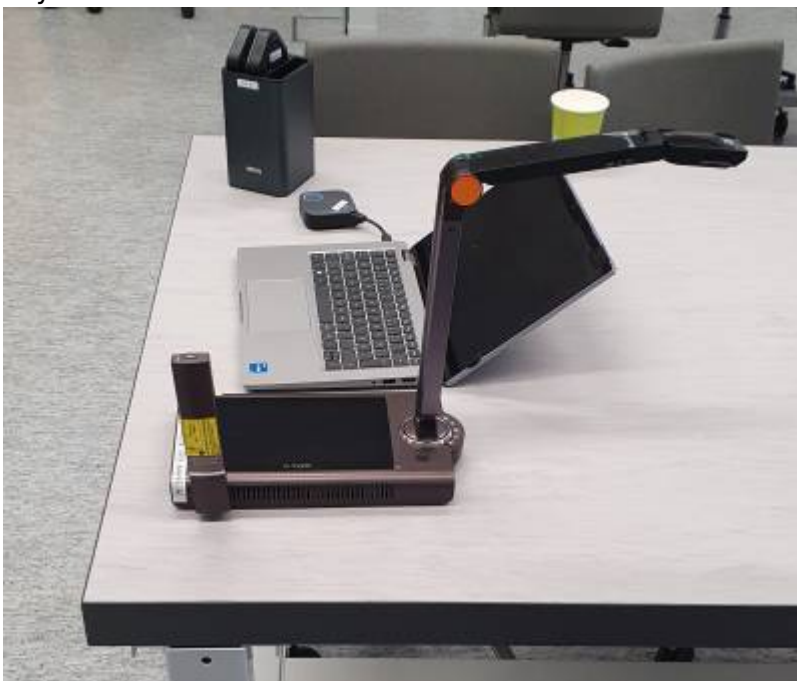
Physiklabor Bild 3