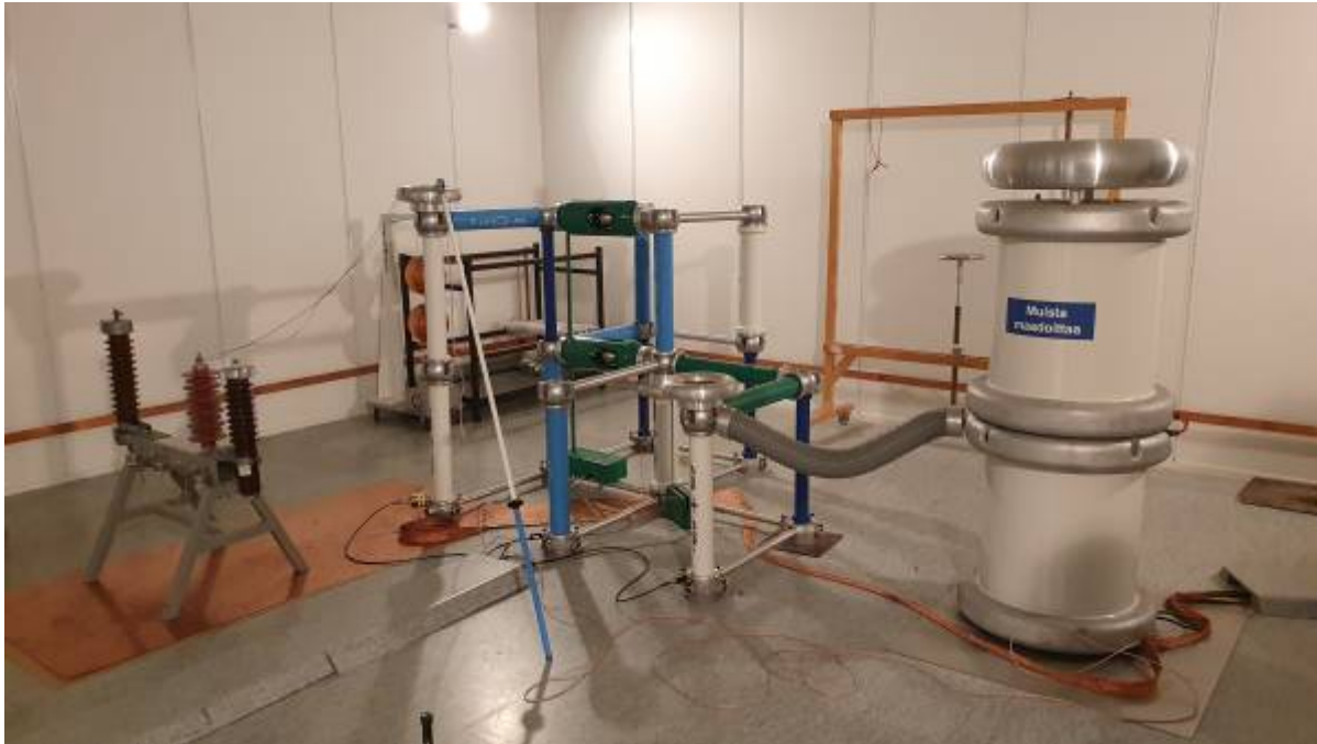
Energietechnik-Labor Bild 2