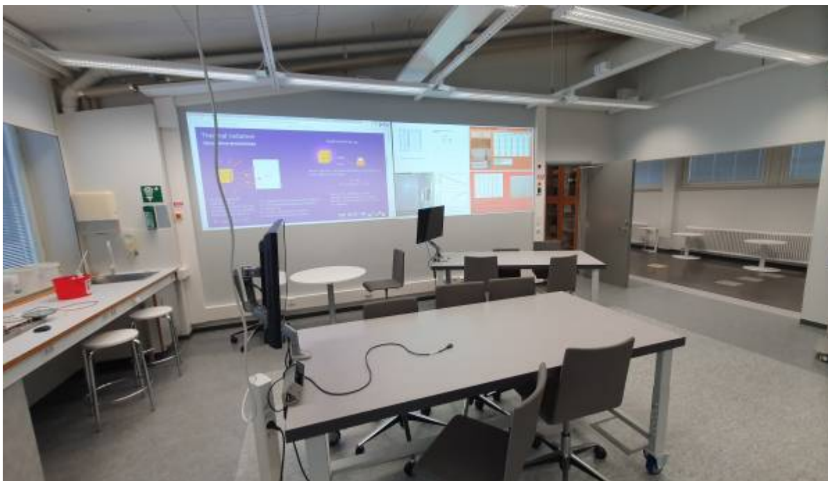
Physiklabor Bild 1