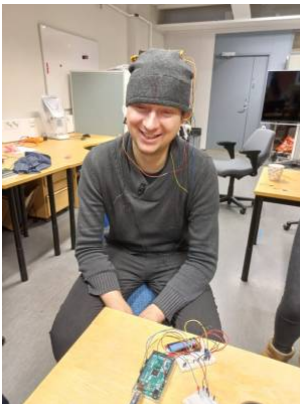
Fig. 1: Verwendung von in Kleidung eingebauten Elektroden an einem Probanden