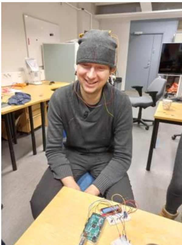
Fig. 1: Verwendung von in Kleidung eingebauten Elektroden an einem Probanden