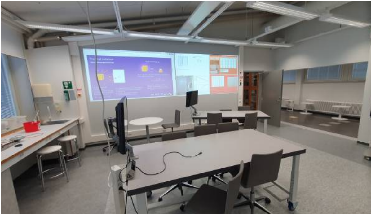
Physiklabor Bild 1