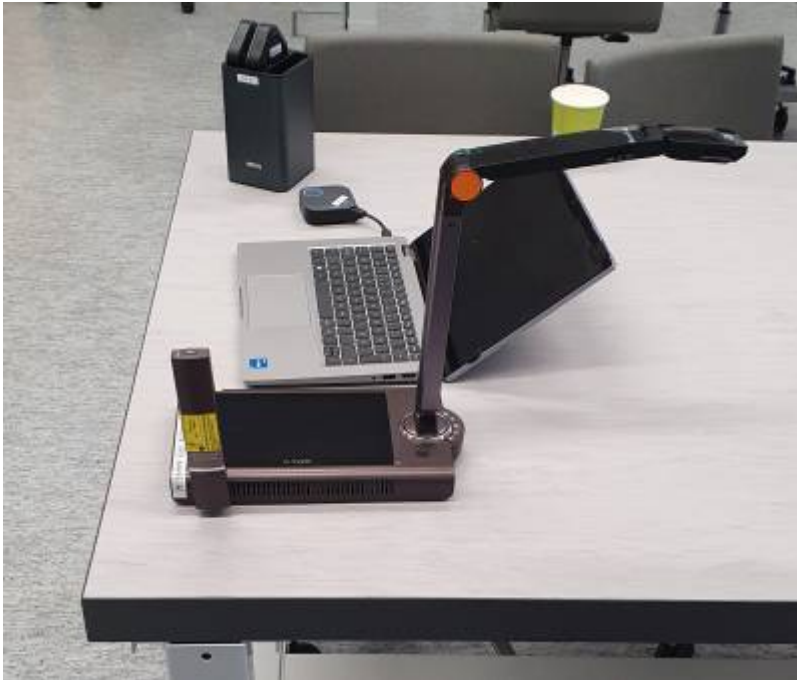
Physiklabor Bild 3