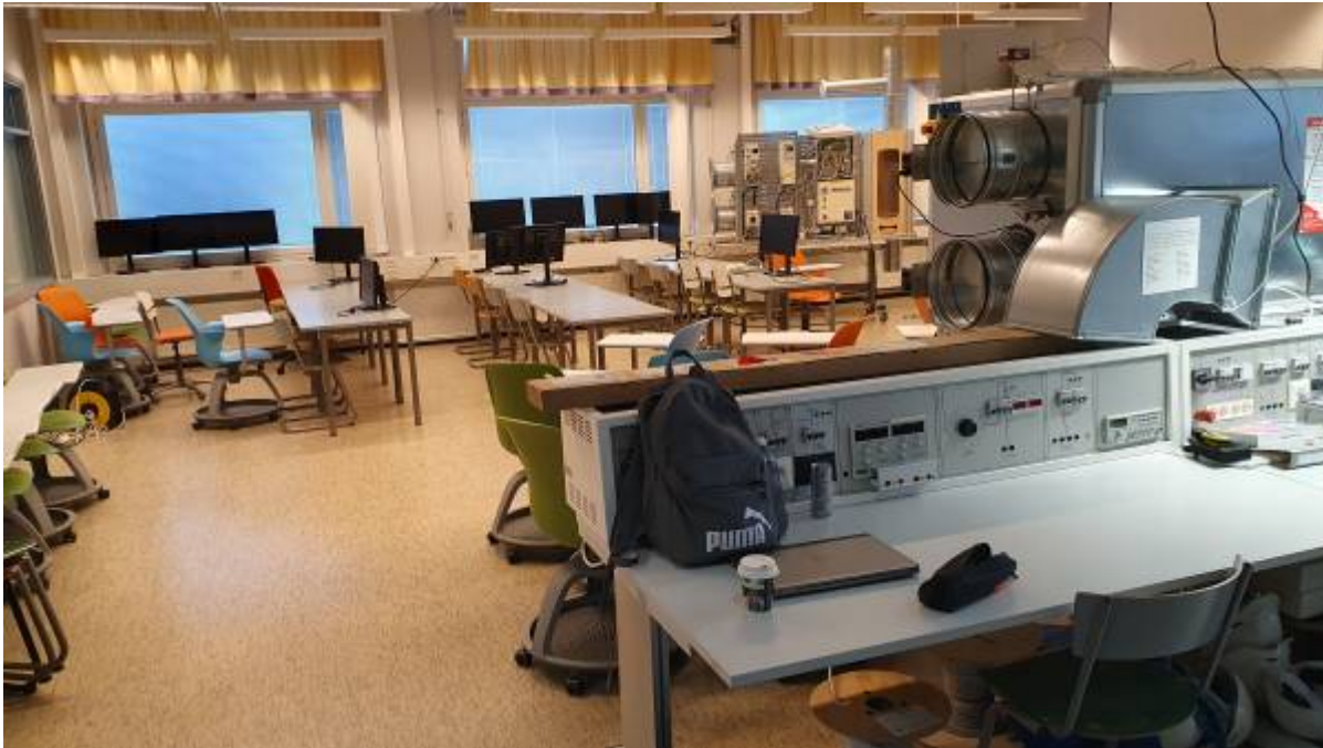
Energietechnik-Labor Bild 1