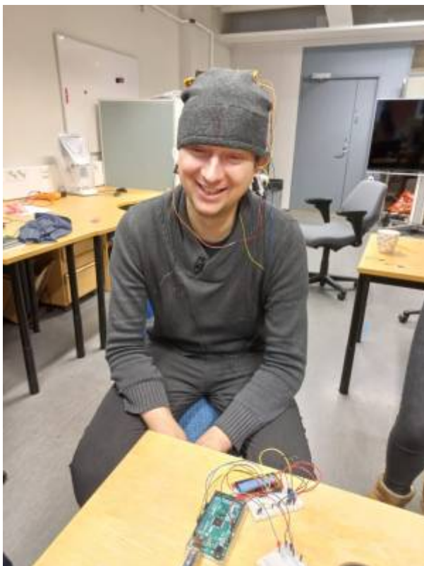
Fig. 1: Verwendung von in Kleidung eingebauten Elektroden an einem Probanden